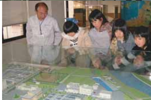
多々良中央中学校の生徒さんも興味津々