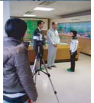
インタビュー風景